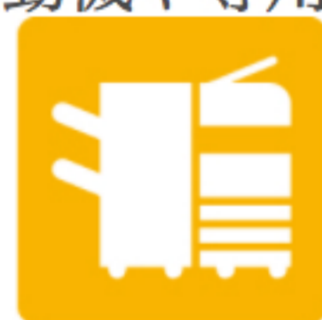
事務用機械器具製造業