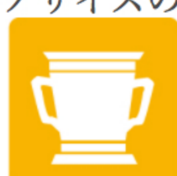
セラミック部品製造業