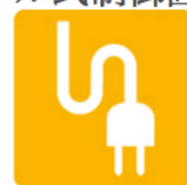
電気機械器具製造業