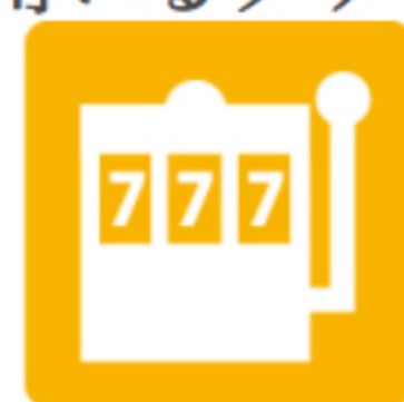
サービス用・娯楽用機械器具製造業